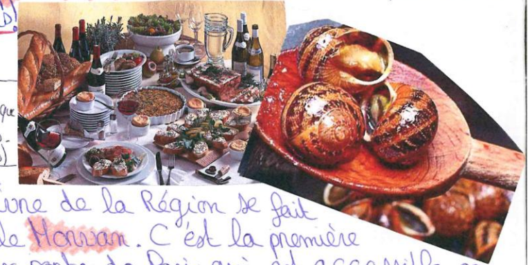
Restaurant gastronomique - Côte Saint-Jacques - L'oiseau. (3 étoiles)